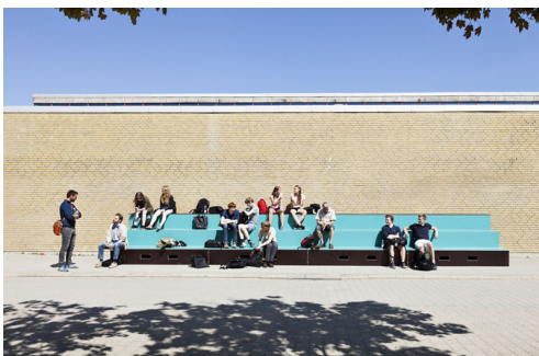
Midlertidige møbler på DTU campus