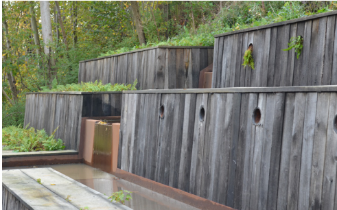
Klimaprojektet i Gladsaxe - Skybrudsparken