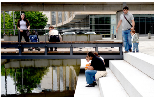
Bro og kanalfront, Ørestad City Skole