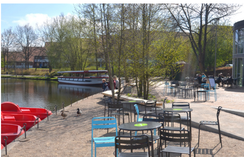
Åbrink ved Filosoffen, Odense Å